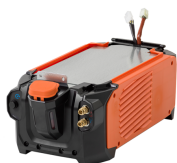
Master Cooler 05M

Unité de refroidissement pour un remplissage du liquide de refroidissement simple, rapide et pratique avec éclairage LED intégré pour les niveaux de liquide de refroidissement.