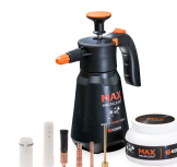
MAX WeldClean Starter Kit, small

Commande à distance en option sur la torche avec un commutateur de commande de courant à bascule. Disponible pour les modèles de torches Flexlite refroidis par eau et par gaz.